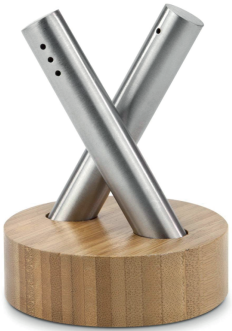
Abbildung ca. 1:1