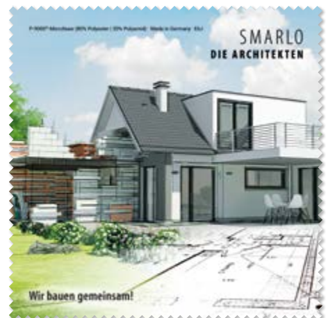
Ansicht des fertigen Brillentuchs