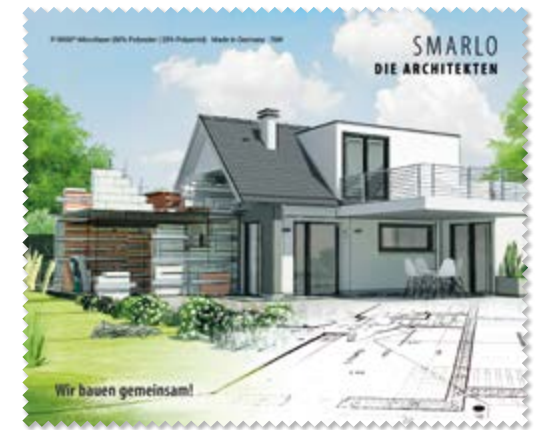
Ansicht des fertigen Brillentuchs